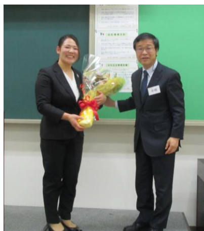
講演終了後、寺嶋会長から花束贈呈